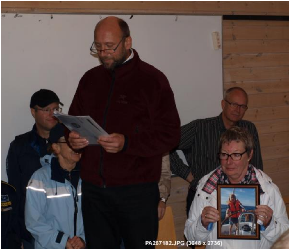
PA267182.JPG (3648 x 2736)